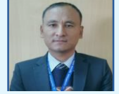
रोशन कोइ निर्देशक, सा.सु.कोष